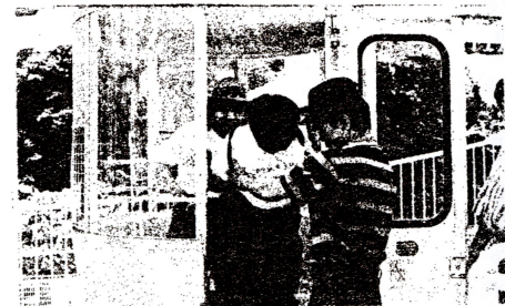
「みえちゃん、だいたいおぼえる」 「足元に気を付けて...」