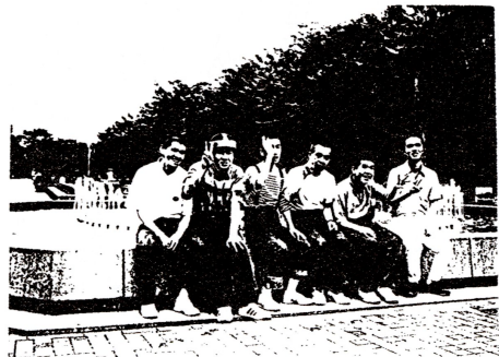
「皆、いい顔してるね ピース! ピース!!」