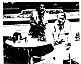
「しんやんは お母さんと一緒にハイポーズ」