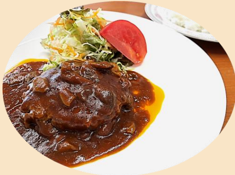
デミグラスソース